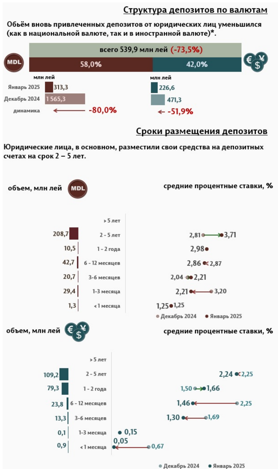
Инфографика 3. Вновь привлечённые срочные депозиты от юридических лиц

В январе 2025 г., по сравнению с предыдущим месяцем, объём депозитов юридических лиц в национальной валюте существенно уменьшился на 80%, а в иностранной валюте на 51,9% (Инфографика 3). Депозиты юридических лиц в национальной валюте составили 313,3 миллиона леев, а в иностранной валюте – 226,6 миллиона леев. По сравнению с январём 2024 г., объём депозитов юридических лиц в национальной валюте уменьшился на 60,7%, а в иностранной валюте увеличился на 30,1%.