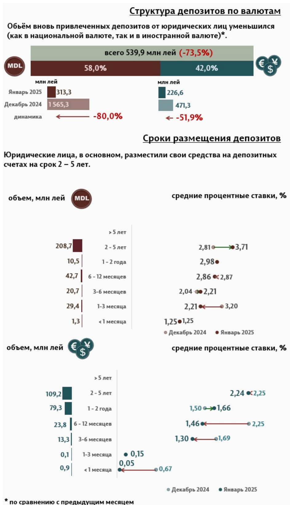
Инфографика 3. Вновь привлечённые срочные депозиты от юридических лиц

В январе 2025 г., по сравнению с предыдущим месяцем, объём депозитов юридических лиц в национальной валюте существенно уменьшился на 80%, а в иностранной валюте на 51,9% (Инфографика 3). Депозиты юридических лиц в национальной валюте составили 313,3 миллиона леев, а в иностранной валюте – 226,6 миллиона леев. По сравнению с январём 2024 г., объём депозитов юридических лиц в национальной валюте уменьшился на 60,7%, а в иностранной валюте увеличился на 30,1%.