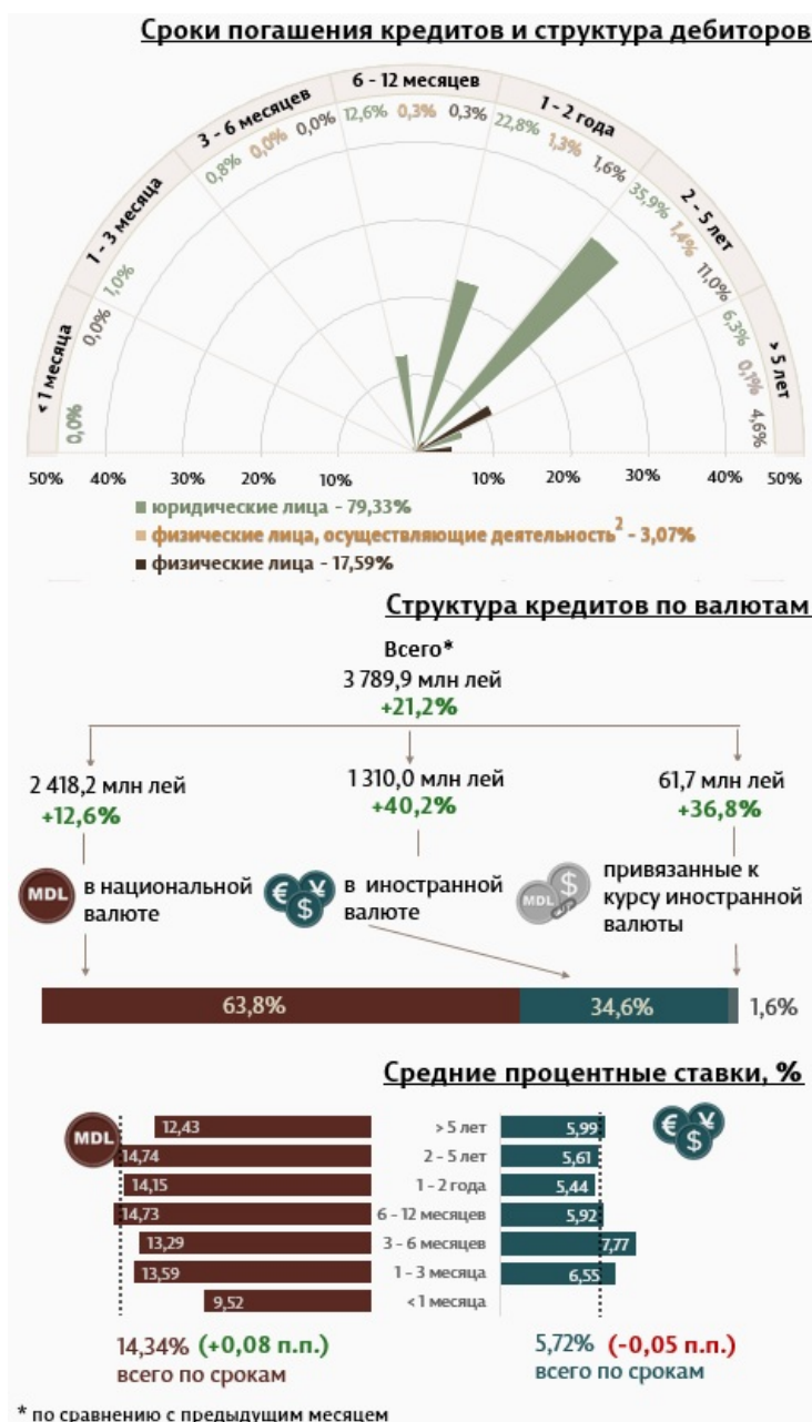
Инфографика 1. Динамика вновь выданных кредитов

Из перспективы сроков выданных кредитов, самыми привлекательными были кредиты, выданные сроком от 2 до 5 лет с долей 48,3% от общего объема выданных кредитов. Объем данных кредитов, выданных юридическим лицам, составил 35,9% от общего объема кредитов.