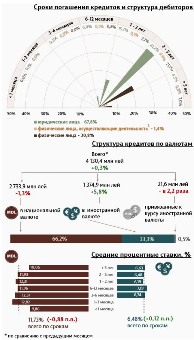
Инфографика 1. Динамика вновь выданных кредитов

С точки зрения сроков выдачи кредитов, самыми привлекательными были кредиты, выданные на срок от 2 до 5, лет с долей 63,2% от общего объема выданных кредитов. Объем данных кредитов, выданных юридическим лицам, составил 41,2% от общего объема кредитов.