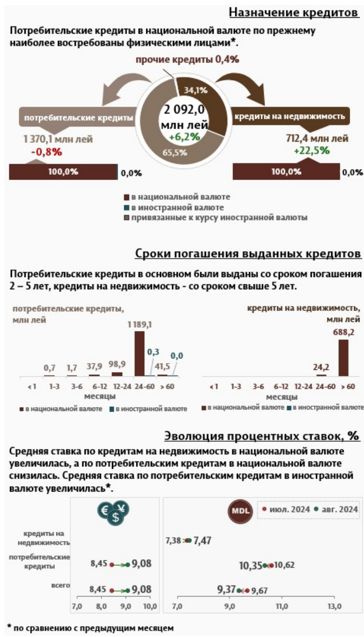
Инфографика 2. Вновь выданные кредиты физическим лицам

Физические лица в августе 2024 года получили кредиты в объеме 2 092,0 миллиона леев, на 6,2% больше по сравнению с предыдущим месяцем, из которых значительная часть (65,5%) была представлена потребительскими кредитами (Инфографика 2). Большая часть потребительских кредитов выданные физическим лицам (1 189,1 миллиона леев), была выдана в национальной валюте со сроком от 2 до 5 лет.