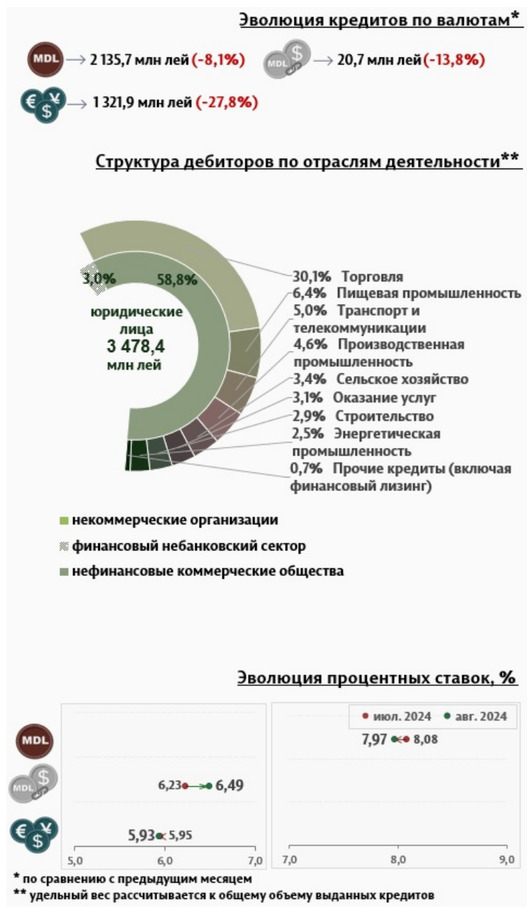
Инфографика 3. Вновь выданные кредиты юридическим лицам

Средняя ставка по кредитам, выданным юридическим лицам в национальной валюте, снизилась на 0,11 п.п., до уровня 7,97%. В то же время средняя ставка по кредитам, выданным в иностранной валюте, снизилась на 0,02 п.п. и составила 5,93%.