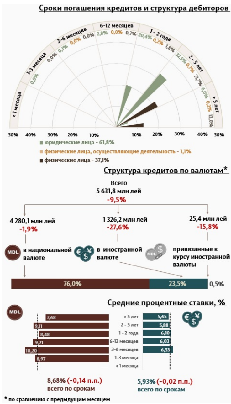
Инфографика 1. Динамика вновь выданных кредитов

С точки зрения сроков выданных кредитов, наибольшим спросом пользовались кредиты на срок от 2 до 5 лет, доля которых составила 54,9% от общего объема выданных кредитов. Объем данных кредитов, выданных юридическим лицам, составил 32,5% от общего объема кредитов.