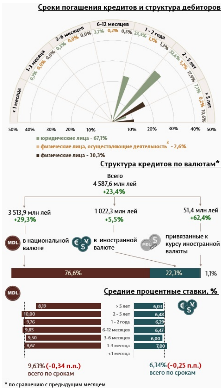
Инфографика 1. Динамика вновь выданных кредитов 2

С точки зрения сроков выданных кредитов, самыми привлекательными были кредиты, выданные на срок от 2 до 5 лет с долей 51,7% от общего объема выданных кредитов. Объем данных кредитов, выданных юридическим лицам, составил 32,6% от общего объема кредитов.