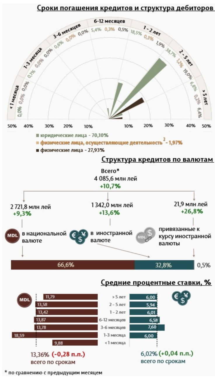
Инфографика 1. Динамика вновь выданных кредитов.

С точки зрения сроков выданных кредитов, самыми привлекательными были кредиты, выданные на срок от 2 до 5 лет, которые составили 58,9% от общего объема выданных кредитов. Объем данных кредитов, выданных юридическим лицам, составил 38,7% от общего объема кредитов.