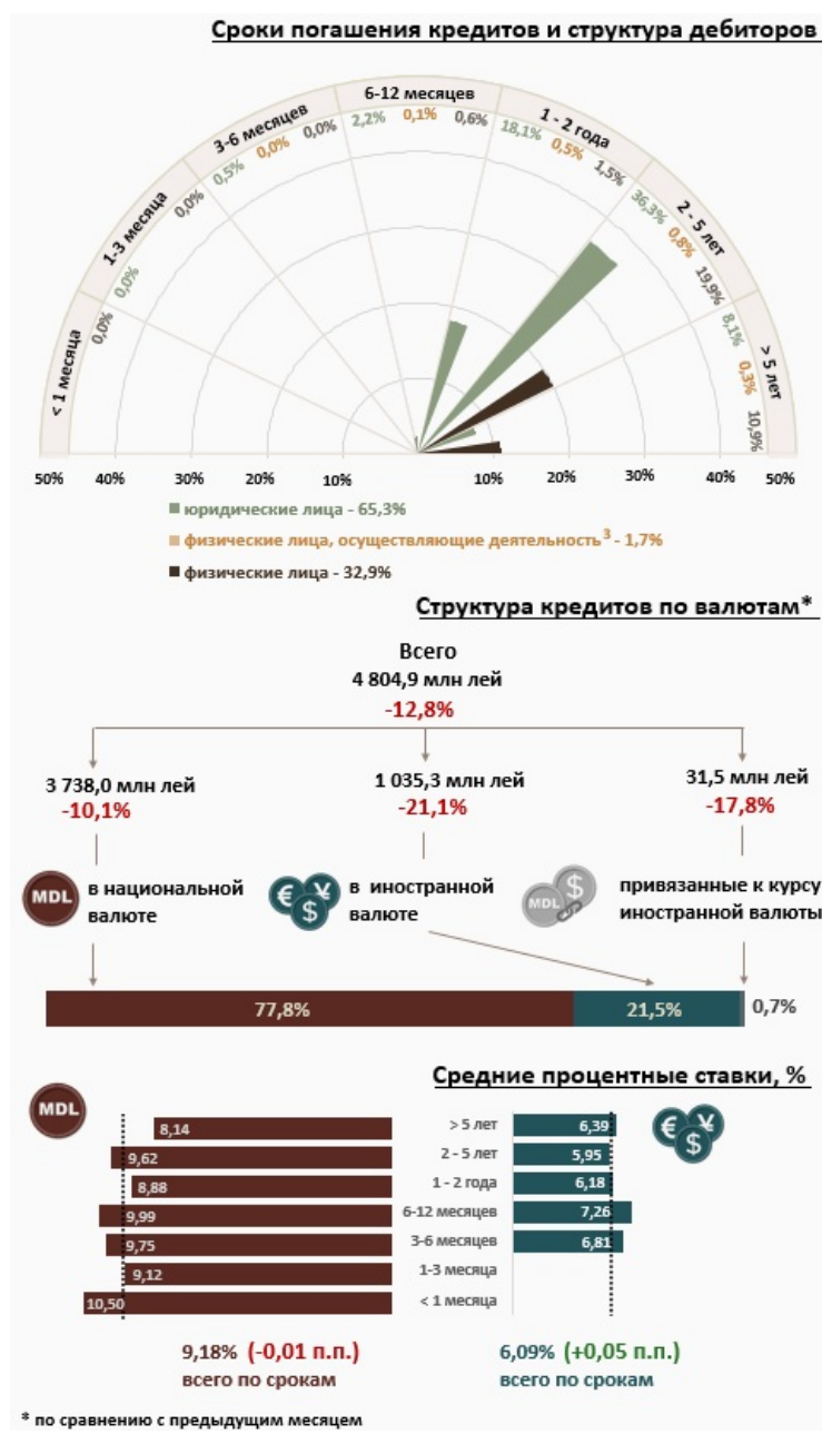
Инфографика 1. Динамика вновь выданных кредитов 2

С точки зрения сроков выданных кредитов, наибольшим спросом пользовались кредиты на срок от 2 до 5 лет, доля которых составила 57,0% от общего объема выданных кредитов. Объем данных кредитов, выданных юридическим лицам, составил 36,3% от общего объема кредитов.