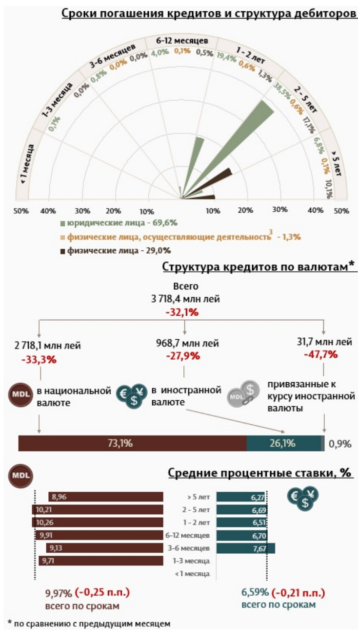
Инфографика 1. Динамика вновь выданных кредитов 2

С точки зрения сроков выданных кредитов, самыми привлекательными были кредиты, выданные на срок от 2 до 5 лет с долей 56,2% от общего объема выданных кредитов. Объем данных кредитов, выданных юридическим лицам, составил 38,5% от общего объема кредитов.