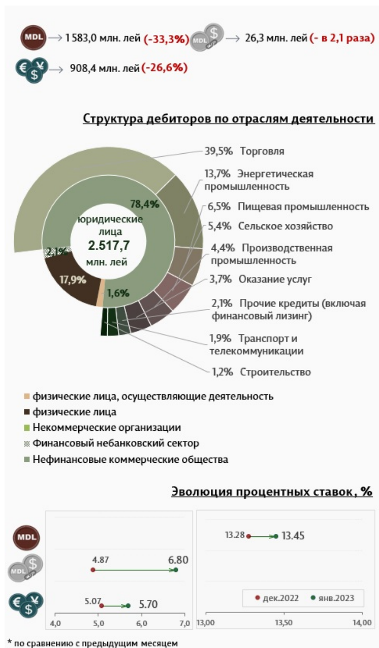
Инфографика 3. Вновь выданные кредиты юридическим лицам

Средняя ставка по кредитам, выданным юридическим лицам (Инфографика 3) в национальной валюте, увеличилась на 0,17 процентных пункта, до уровня 13,45%. В то же время средняя ставка по кредитам, выданным в иностранной валюте, увеличилась на 0,62 процентных пункта и составила 5,70%.