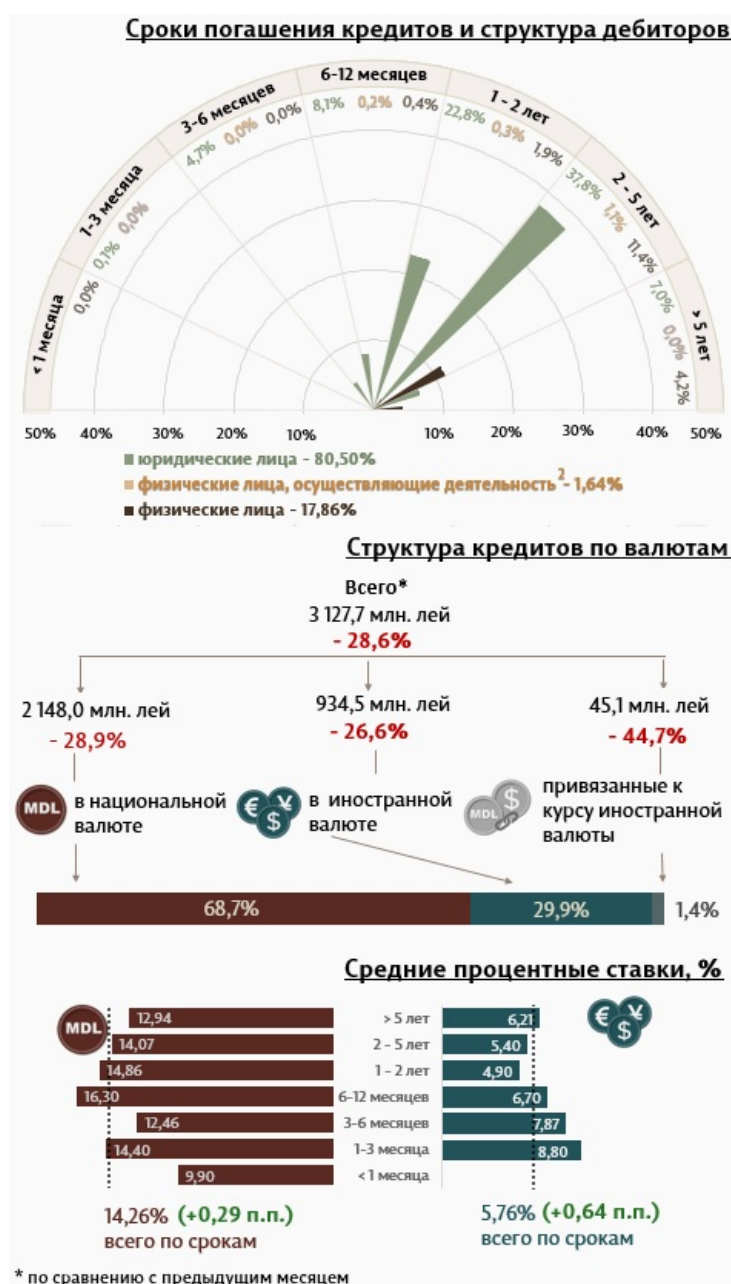
Инфографика 1. Динамика вновь выданных кредитов

Из перспективы сроков выданных кредитов, самыми привлекательными были кредиты, выданные сроком от 2 до 5 лет с долей 50,3% от общего объема выданных кредитов. Объем данных кредитов, выданных