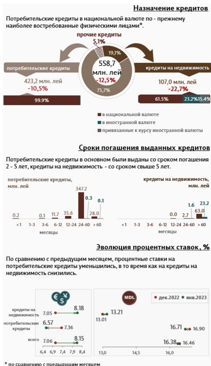
Инфографика 2. Вновь выданные кредиты физическим лицам

Кредиты на недвижимость составляют 19,1% от всех кредитов, выданных физическим лицам, и были предоставлены в основном в национальной валюте (61,5% от общего объема кредитов на недвижимость).