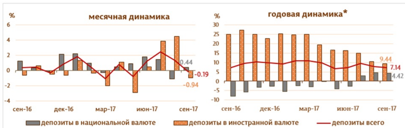
Диаграмма 2. Динамика депозитов Структура депозитов группируется по институциональным секторам в соответствии с Инструкцией о порядке составления и предоставления банками отчета по денежной статистике (Monitorul Oficial al Republicii Moldova nr. 206-215 din 2 decembrie 2011) [1]

Сальдо депозитов в национальной валюте увеличилось на 136.0 млн. леев и составило 31185.2 млн. леев, составив долю 55.2% от общего сальдо депозитов, а сальдо депозитов в иностранной валюте (пересчитанное в леях) снизилось на 240.9 млн. леев до уровня 25266.5 млн. леев, с долей 44.8% (диаграмма 2).