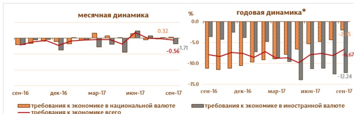
Диаграмма 3. Динамика требований к экономике

Сальдо требований экономике В соответствии с методологией МВФ, из общей суммы требований к экономике (включающей начисленные проценты по кредитам банков, находящимся в стадии ликвидации) исключаются кредиты нерезидентов, межбанковские кредиты и кредиты, выданные Правительству Республики Молдова в сентябре 2017 снизилось на 214.9 млн. леев (0.6%) за счет снижения требований к экономике в валюте (выраженных в MDL) на 284.3 млн. леев (1.7%), в то время как требования в национальной валюте выросли на 69.4 млн. леев (0.3%) (диаграмма 3). Следует отметить, что требования к экономике в валюте, выраженные в USD, снизились в течении отчетного периода на 3.3 млн. USD.