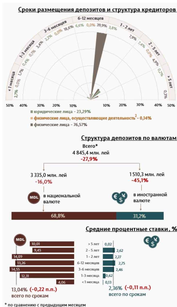
Инфографика 1. Динамика вновь привлеченных депозитов

С точки зрения сроков размещения, наибольшая доля принадлежит депозитам сроком от 6 до 12 месяцев, что составляет 46,5% от общего объема привлеченных срочных депозитов. Депозиты физических лиц,