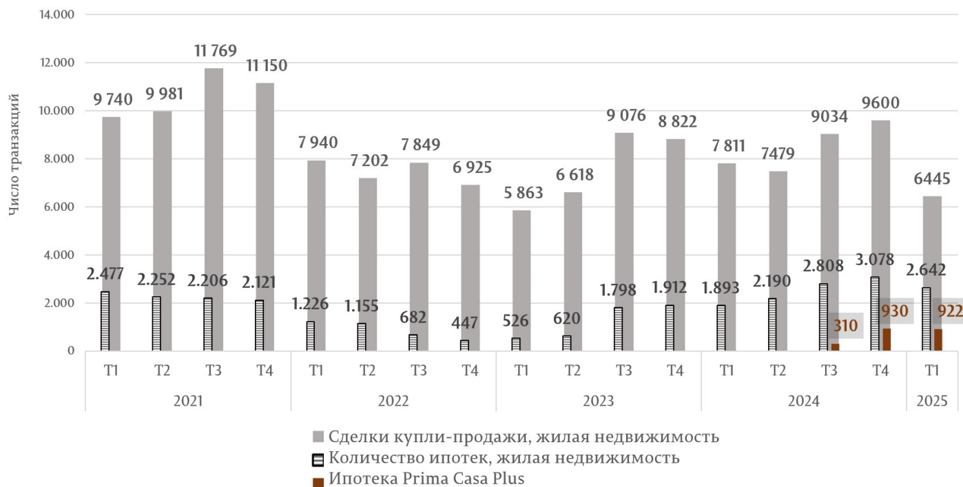
Рисунок 2. Объем купли-продажи жилой недвижимости в Кишиневе