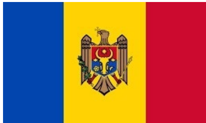
Трансляция на румынском языке:

Встреча учредителей Международного валютного фонда и Всемирного банка в Кишиневе: