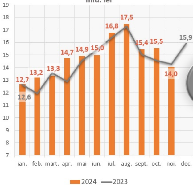
Dinamica lunară a eliberărilor banilor în numerar, mld. lei