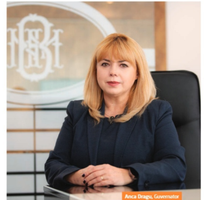
Anca Dragu, Guvernator al Băncii Naționale a Republicii Moldova / Governor of the National Bank of the Republic of Moldova

Totodată, a fost acordată o atenție sporită modernizării infrastructurii financiare naționale. Digitalizarea, siguranța tranzacțiilor și continuitatea operațională au fost priorități clare. Sistemul național de plăți instant MIA, creat de BAN și lansat în primăvara anului 2024, este utilizat astăzi de fiecare al doilea